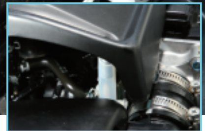
○雨水受けからホースにジョイント