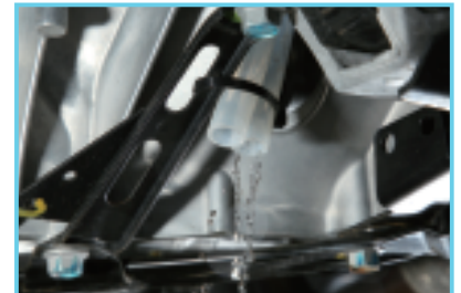
○エンジン下部から車外に放出される