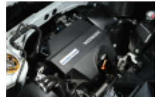
※純正は雨水が入り放題